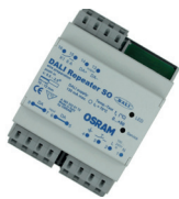
DALI-repeater DIN - C3N01