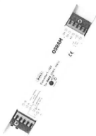
DALI-omvormer DIN - C3N03